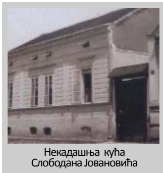
Некадашња кућа Сlobодана Јовановића

Фонд Сlobодан Јовановић 11. децембра обележио је прву годишњицу свог постојања, која је протекла у знаку манифестације посвећене 140 година од рођења једног од највећих српских интелектуалаца 20. века. Три манифестације – изложба, трибина и представљање књиге - обележиле су 140 година од како се Сlobодан Јовановић родио у Новом Саду, 4. децембра 1869. године. У Београду, у предворју читаонице Правног факултета, 4. децембра, отворена је изложба "СЛОБОДАН ЈОВАНОВИЋ 1869-1958."